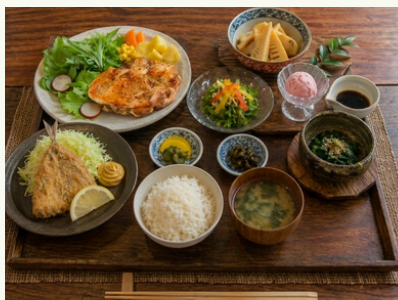
グリルチキン御膳