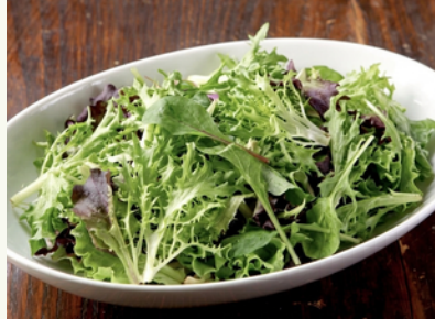
グリーンサラダ すりおろし野菜ドレッシング ¥1,000