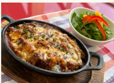
ミートドリア ミニサラダ付き ¥1,100