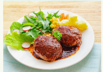
ハンバーグ デミ/おろしポン酢 ¥1,700