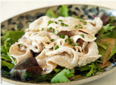
豚冷しゃぶ ゴマ/ポン酢 ¥1,200