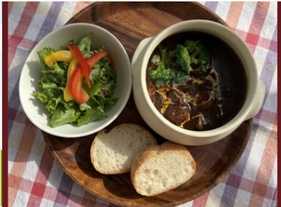
ビーフシチュー バケット・ミニサラダ付き ¥1,200

dinner Time / 18:00-20:00 last order / 17:00